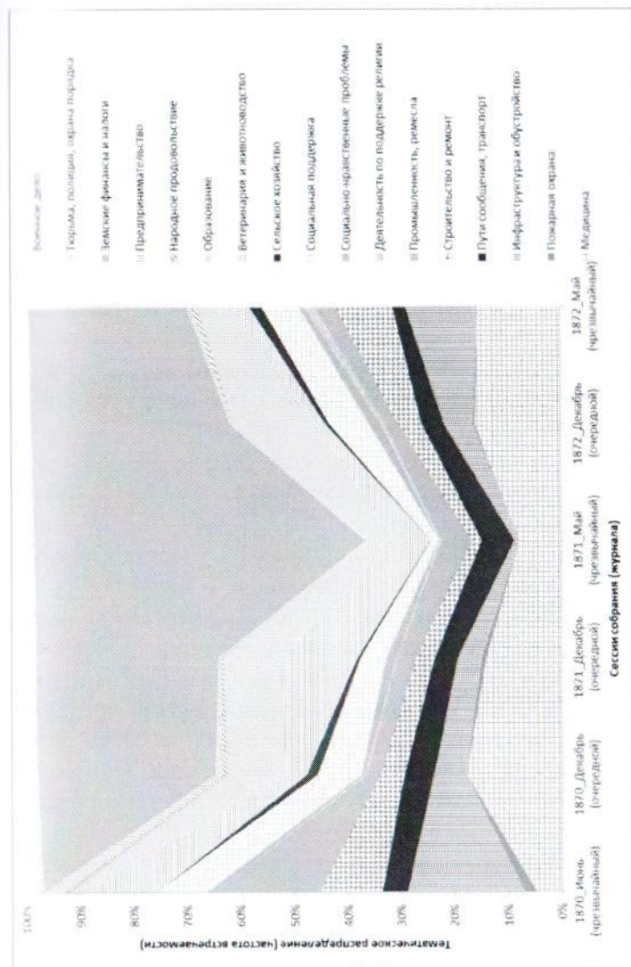
Рис. 1. Карта тематического распределения по данным корпуса журналов Пермского губернского земского собрания за 1870—1872 гг.

Для определения наиболее часто обсуждаемых тем и основных интересов земских деятелей по журналам Пермского губернского земского собрания [2—7] созданы и проанализированы частотные таблицы рассмотрения в земстве различных проблем и вопросов. Также выделены приоритетные направления деятельности гласных. Корпус журналов и отдельные подкорпуса выступлений гласных подвергнуты компьютеризованному контент-анализу. Для его проведения использовалась программа AntConc. Анализ выполнялся по 17 тематическим спискам, соответствующим основным направлениям земской деятельности. Каждый список содержит слова-индикаторы, характеризующие конкретные сферы работы земства. Затем были созданы частотные таблицы в целом по трехлетию, по журналам и отдельным гласным и карты тематического распределения (рис. 1).